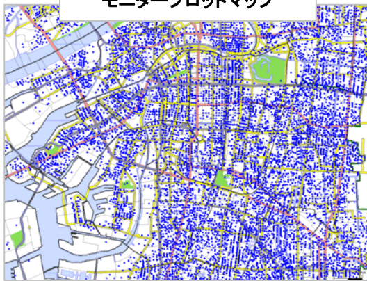
モニタープロットマップ

当社は国内最大級となる約180万人の登録会員を擁する情報配信サービス「フルーツメール」を運営するアイブリッジ株式会社との業務提携により、約180万人の『フルーツメール会員(ネットリサーチモニター)』の属性データを、当社が開発・販売するGIS(地理情報システム)『マーケティング・ダイナミックシステム(以下、MDS)』に搭載し、地理的条件やモニター属性(約100項目)の複合条件で検索、該当するモニターにインターネットリサーチが可能なサービス、「GISネットリサーチ」を開始いたしました。